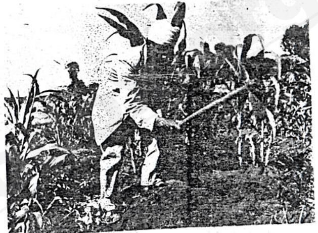
ከሁኑ ደግሞውን ይዘው ሰባላቸውን ሲተኩሱ

ቡድኑ በጥናቱ መሠረት በገዳሙ ውስጥ የሚገኙትን መነኮሳት በአስተ ማማኝ ሁኔታ ሊያቋቁሙና ራሳቸውን ሊያስችላቸው የሚችሉ የእርሻ ልማት ለመስጠትም የሚያበቁትን ሐሳቦች አቅ ርቧል ።