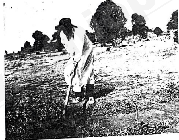
መነኮሰው በልማት ሥራ ሲሳተፍ

ሆኖም የእህል ወፍራሙ ከ፲፭ ዓመ ታት በፊት ተተክሎ ለረዥም ጊዜ ሲያ ገለገል ቆይቶ ከባድ ብልሽት ደርሶ በት ለኛ ወራት ያህል አገልግሎቱን በማቋረጡ በገዳሙ ላይ ከባድ ችግር ደርሶ ነበር ። ይኸውም እንደኛ ገዳሙ ከወፍራሙ ከራይ የሚያገኘው ገቢ በድ ገነት በመቋረጡ ሲሆን ለሳውደግም ወፍራሙ ተበላሽቶ ከጥቅም ውዋ በነበረበት ወቅት በገዳሙ የሚገኙ መነኮሳት የኛ ሰዓት ደርሶ መልስ ሰጠን ገድ እህል በአሁያ በማጓጓዝ ለግብፈ ጫት የተገደዱ መሆናቸው ነበር ።